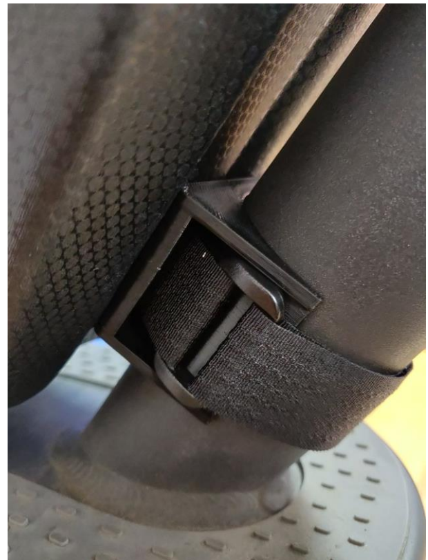
Prawidłowy montaż uchwytów.

h) Otwieramy torbę i podłączamy złącza, które się w niej znajdują i) Gotowe! Hulajnoga jest gotowa do użytku! :)