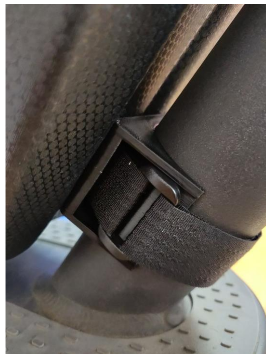
Prawidłowy montaż uchwytów.