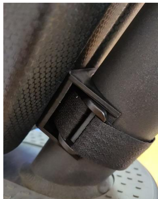
Assemblage correct des poignées

9. Fini ! La trottinette est prête à être utilisée ! :)