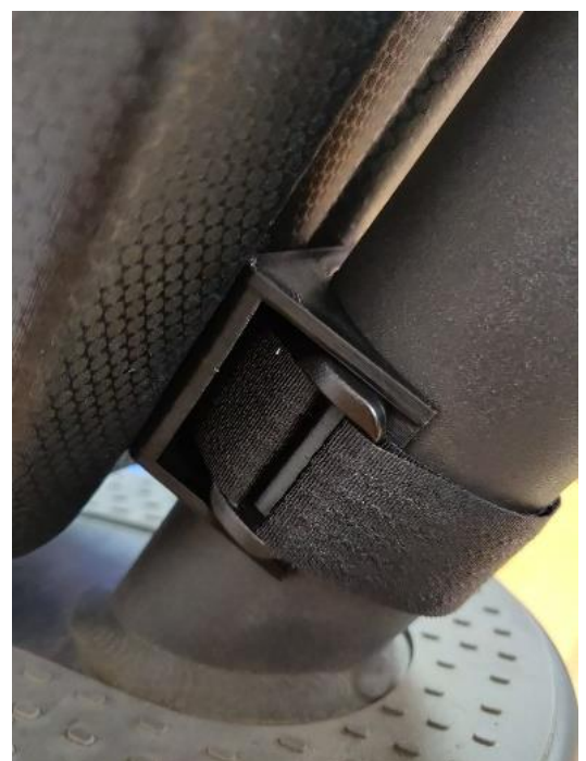
Korrekte Montage der Griffe

9. Fertig! Der Roller ist fahrbereit! :)